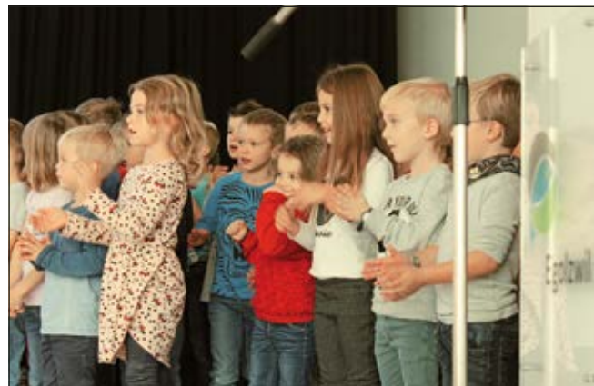
Die Schüler sangen begeistert ihr einstudiertes Lied vor.

Zeichen von Obst und Gemüse strotzten die Schüler regelrecht vor Energie. Die Seniorinnen und Senioren strahlten zufrieden, doch fühlten sich, wie sie lachend selbst zugeben mussten, nach dieser intensiven Woche auch ein klein wenig erschöpft.