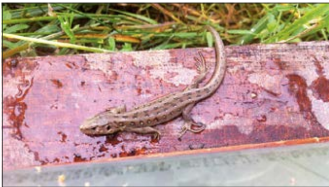
Zauneidechse beim Bienenbesuch

Wir bauen Kleinstrukturen für Zauneidechsen. Zu diesem freiwilligen Arbeitseinsatz heissen wir Personen herzlich willkommen, welche gerne im Freien arbeiten und einen Beitrag zum Erhalt der einheimischen Fauna leisten wollen. Auch Kinder in Begleitung Erwachsener sind herzlich eingeladen. Für Verpflegung ist gesorgt. Wir freuen uns auf Deine Anmeldung.