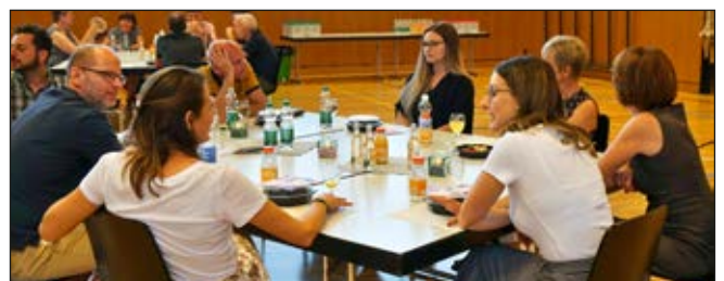
«Apéro» sitzend mit Abstand.