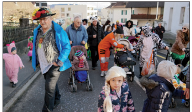
Bunter Einzug von Kinder und Eltern in Egolzwil.

Redaktionsschluss für April 22. März 2016 9.00 Uhr