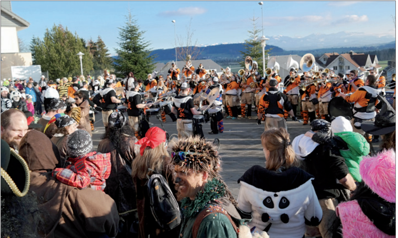
Empfang von Kindern & Eltern beim Einzug in die Schulanlage Egolzwil durch die heiteren Klänge der Mooschränzer Wauwil

Redaktionsschluss für April 22. März 2016 9.00 Uhr